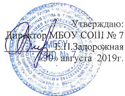
ТАБЛИЦА-СЕТКА ЧАСОВ плана внеурочной деятельности для 5-9-х классов, реализующего федеральный государственный образовательный стандарт основного общего образования 2019 – 2020 учебный год